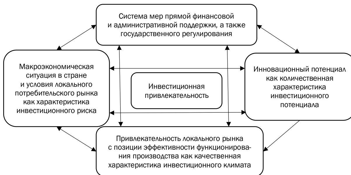
Рис. 1. Факторы, влияющие на инвестиционную привлекательность