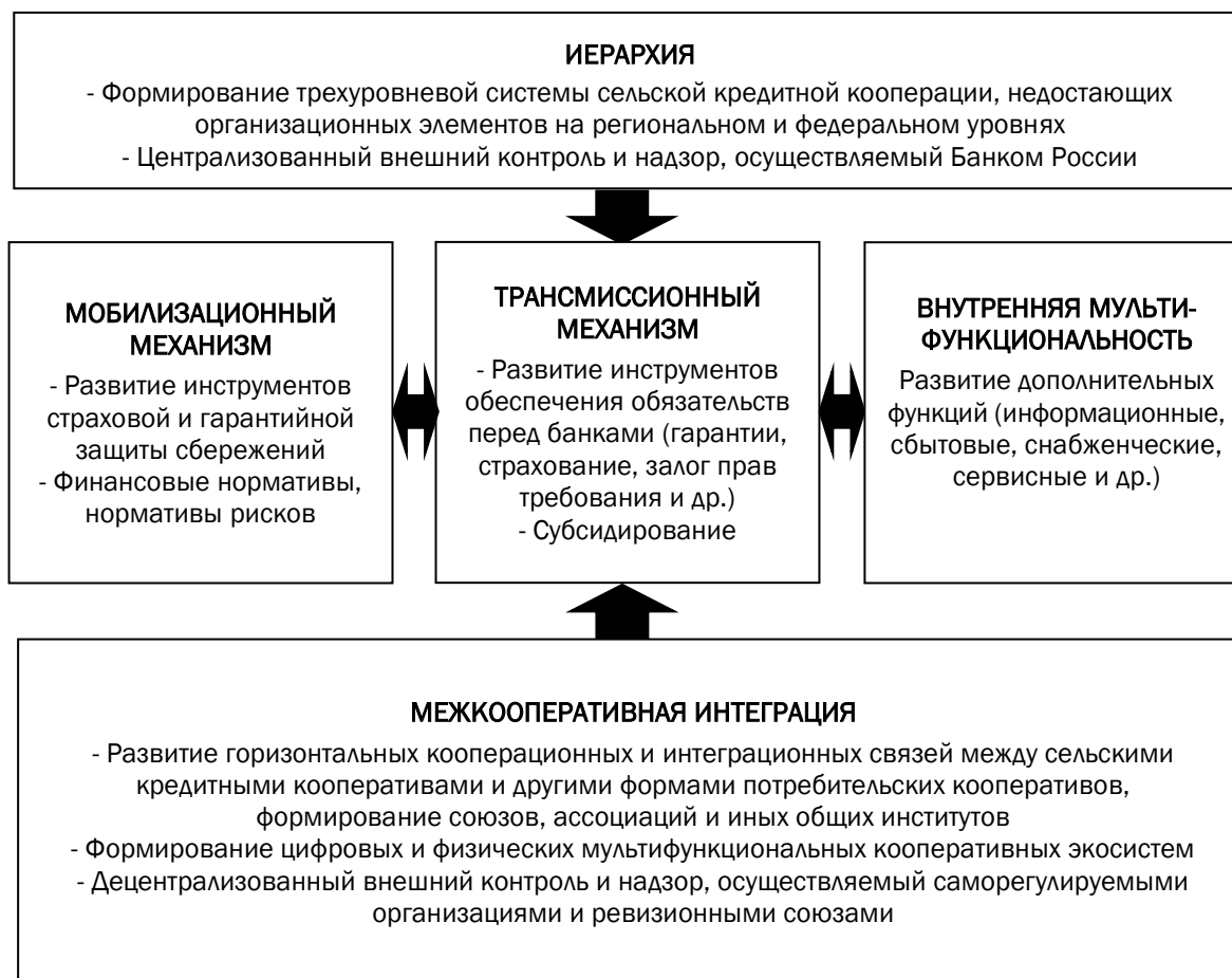
Рис. 1. Пятиэлементная системная модель развития сельской кредитной кооперации

ренцированные по уровню централизации и децентрализации (иерархия или межкооперативная интеграция).