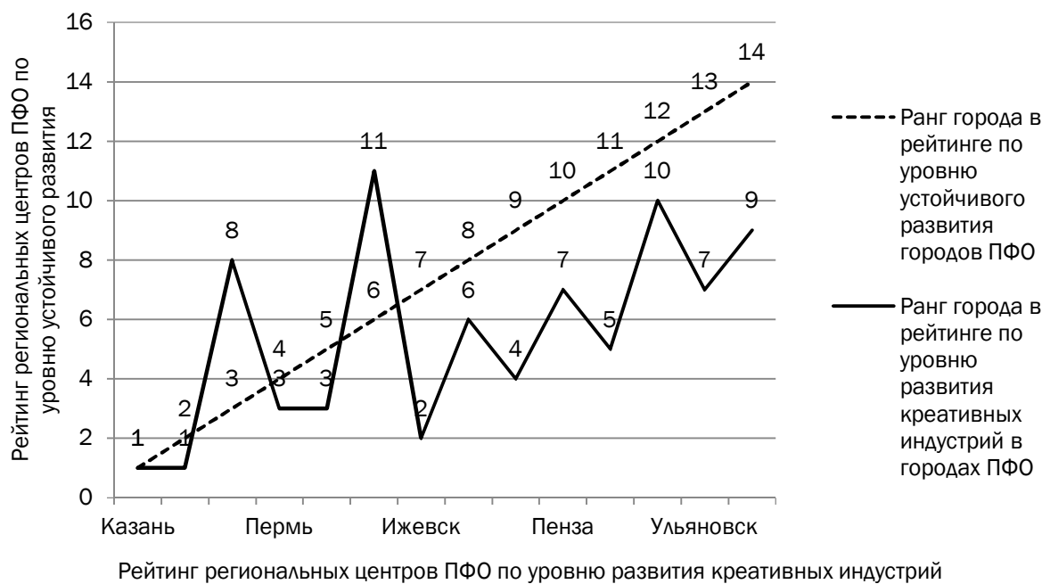
Рис. 3. Характер связи уровней устойчивого развития и развития креативных индустрий региональных центров Приволжского федерального округа