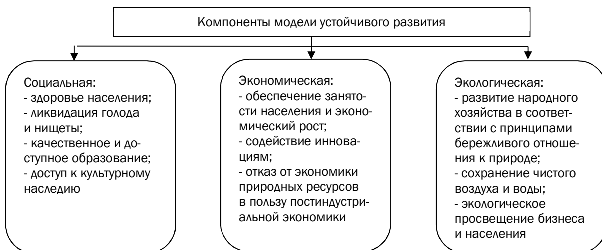
Рис. 1. Компоненты модели устойчивого развития

Согласно градостроительному своду правил планировки и застройки городских и сельских поселений, города страны группируются следующим образом: