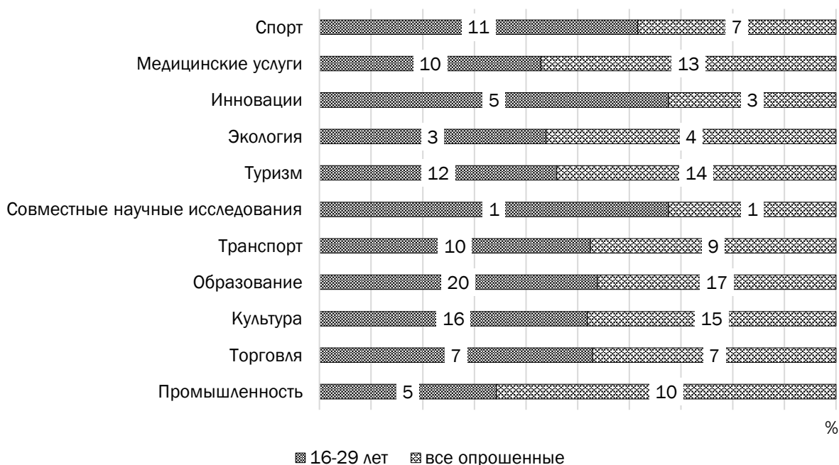
Рис. 3. Распределение ответов на вопрос: «В каких сферах сотрудничества между Западно-Казахстанской областью и Самарской областью есть новые возможности для развития?»

зования, культуры, туризма, транспорта. Среди конкретных предложений были следующие: проведение ярмарок, культурно-спортивных мероприятий, экскурсий для школьников, выставок, гастролей театров, концертов известных певцов.