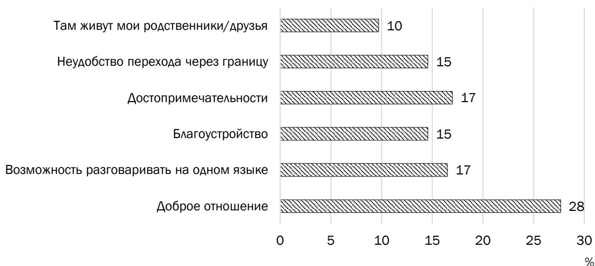
Рис. 1. Распределение ответов на вопрос: «Какие характеристики территории по ту сторону границы являются для вас наиболее важными?»