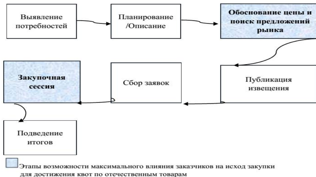
Рис. 3. Блок-схема проведения электронного аукциона по ФЗ №44 с выделением этапов возможностей максимального влияния заказчиков спортивных товаров на исход закупки с целью достижения квот по отечественным товарам