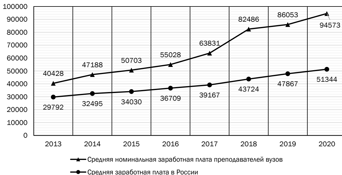
Рис. 3. Динамика средней заработной платы профессорско-преподавательского состава и населения РФ*

Переходя к анализу данных хронометража доцента, можно заметить более благоприятную картину в плане соблюдения баланса между работой и отдыхом. Воскресенье полностью выделяется на нерабочие личные занятия (за единичным исключением), а на субботу приходится в среднем не более 6 часов работы (за исключением единичной пиковой административной нагрузки). Средняя нагрузка на будни составила 7–10 часов в день. Наблюдается гибкий стиль самоорганизации рабочего времени, предполагающий чередование нагрузки по видам деятельности,