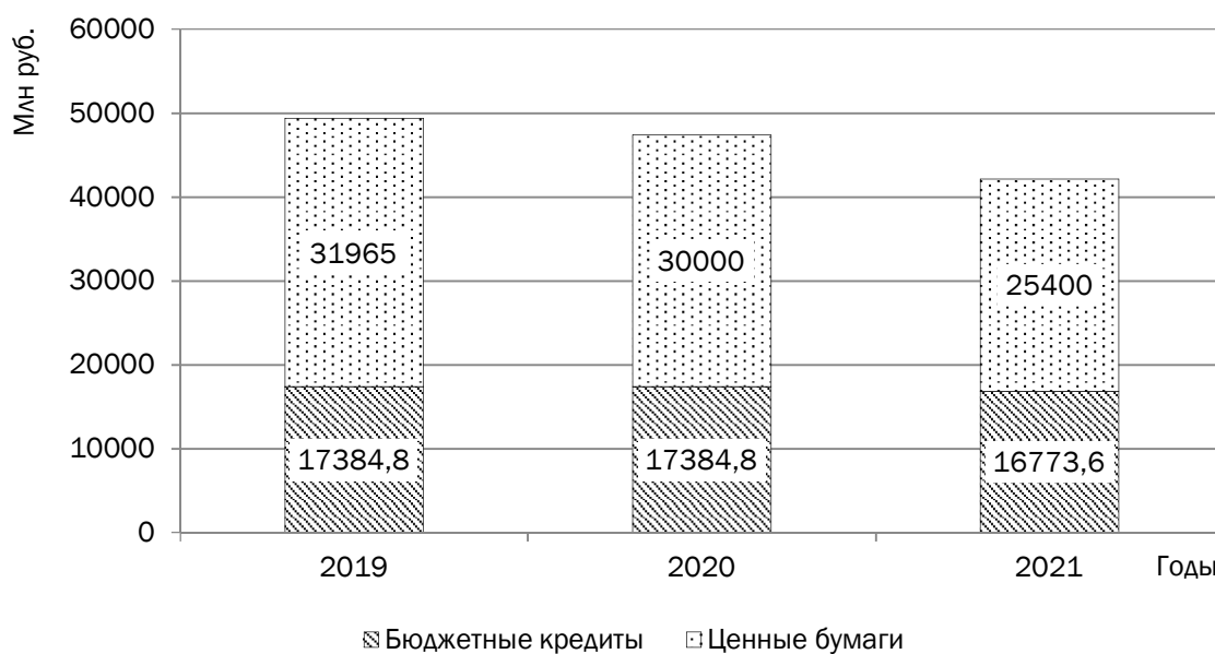
Рис. 2. Структура государственного долга Самарской области в 2019-2021 гг.*

Российские регионы прежде уже были освобождены от погашения обязательств по ранее реструктурированной задолженности по бюджетным кредитам сроком до 2029 г. Нереструктурированные бюджетные кредиты могут быть реструктурированы или списаны. В 2022 г. обязательства регионов погашению не подлежат, в 2023–2024 гг. предусматривается погашение в размере 5% суммы задолженности,