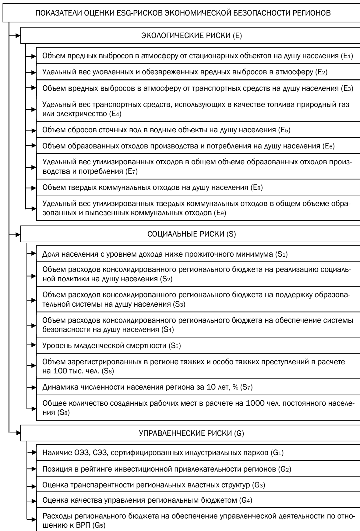
Рис. 3. Система показателей для оценки ESG-рисков РЭБ