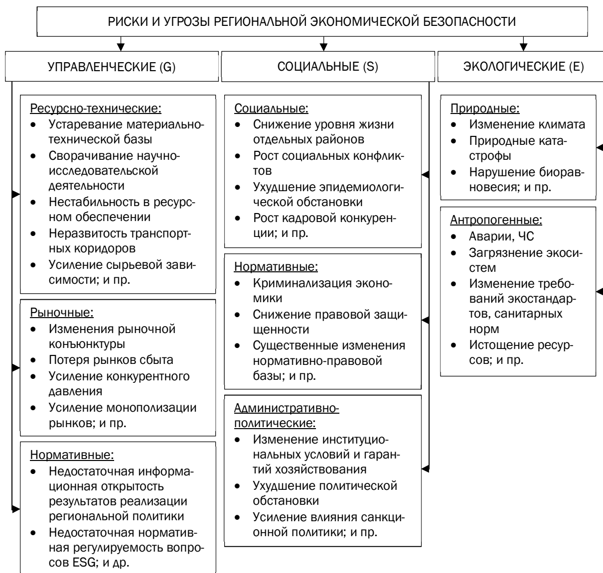
Рис. 2. Декомпозиция ESG-рисков и угроз РЭБ

финансовых рисков и угроз РЭБ регионов – участников транспортных коридоров Нового шелкового пути необходимо проведение более детального изучения состава нефинансовых рисков экономической безопасности на мезо-уровне (рис. 2) [8–9].