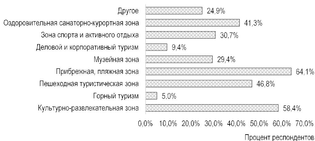
Рис. 3. Результаты опроса респондентов о том, наличие каких зон для них наиболее важно в туристской поездке

Важной составляющей туристско-рекреационного кластера является наличие определенных зон, удовлетворяющих различные потребности туристов. На рис. 3 представлены результаты опроса по предпочитаемым туристами дестинациям.