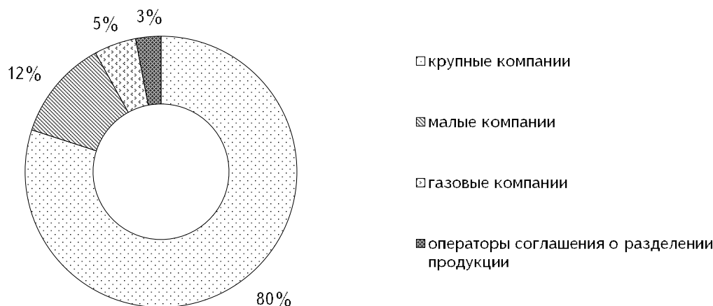
Рис. 1. Структура нефтегазового сектора в России*

* URL: https://www2.deloitte.com/content/dam/Deloitte/ru/Documents/energy-resources/Russian/oil-gas-russia-survey-2019.pdf .