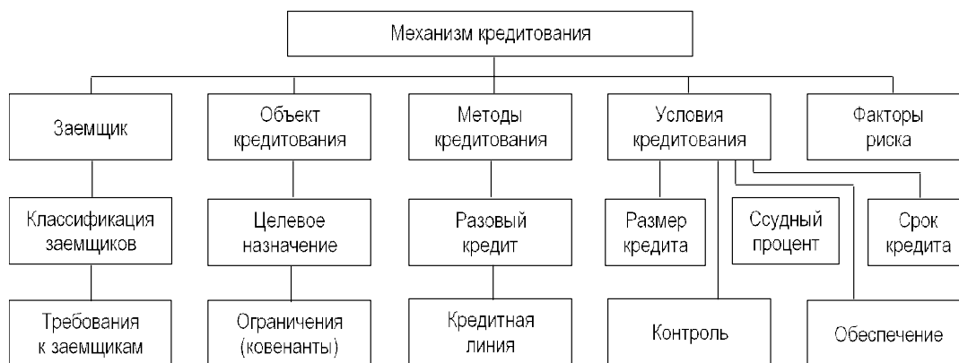
Рис. 1. Структура механизма кредитования