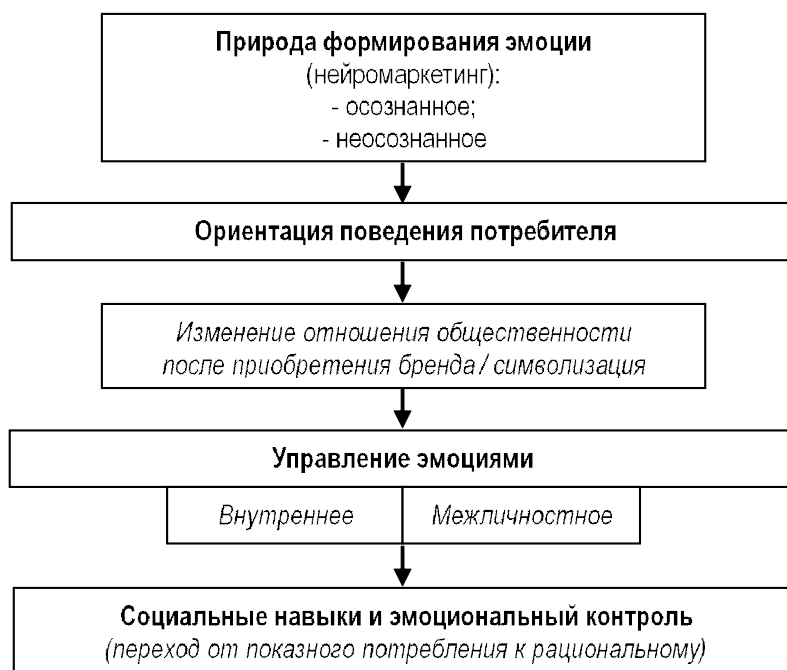
Рис. 3. Модифицированная модель операций с эмоциями

ствием символизации стабильности и качества жизни.