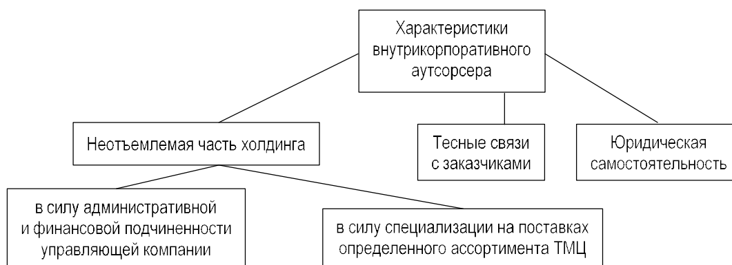
Рис. 2. Отличительные черты внутрикорпоративного аутсорсера складских услуг

У внутрикорпоративного аутсорсера складских услуг при работе с внутрихолдинговыми заказчиками отсутствует часть функций складских операторов рынка: не предоставляется часть информационных услуг, отсутствуют финансово-кредитные услуги. Маркетинговая составляющая складского обслуживания внутрикорпоративного аутсорсера не включает использование ряда важных маркетинговых инструментов, присущих марке-