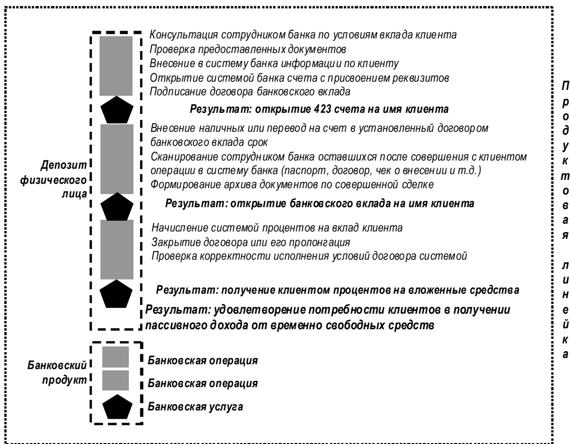
Рис. 1. Место банковского продукта в продуктовой линейке коммерческого банка

Как показал анализ специализированной литературы, а также современных исследований, в Российской Федерации отсутствует однозначное понимание терминов “продуктовая политика”, “банковская инновация”, “банковский продукт”, “банковская операция” и “банковская услуга”. Результат данной ситуации находит отражение в нормативных документах РФ, предполагающих “интуитивную” трактовку рассматриваемых терминов. В этой связи результаты исследования могут быть применены для актуализации нормативных документов, а также для пересмотра коммерческими банками внутренних нормативных документов с це-