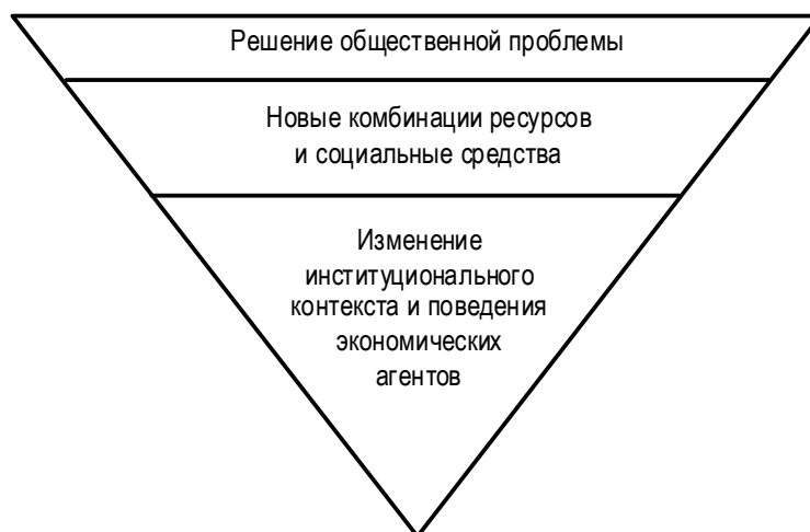
Рис. 1. Схематичное представление трактовки социальных инноваций