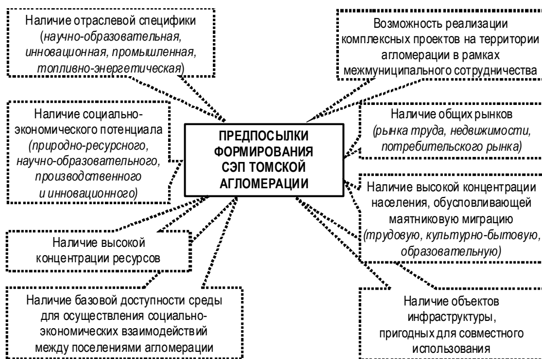
Рис. 1. Предпосылки формирования СЭП Томской агломерации

Социально-экономическое пространство Томской агломерации складывалось под влиянием множества внешних и внутренних факторов, среди которых исторические (обусловившие возникновение СЭП Томской агломерации и течение процесса его эволюции); генезис,