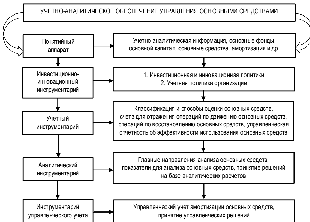
Рис. 3. Модель учетно-аналитического обеспечения управления основными средствами

В данной модели представлен набор аналитических и учетных процедур, выполнение которых способствует построению эффективной системы управления основным капиталом предприятий различных отраслей. В нефтегазовой отрасли это происходит за счет своевременного обеспечения управленческих