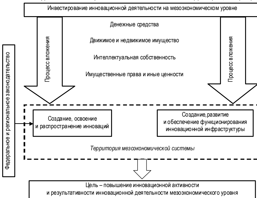
Рис. 3. Авторское представление об инвестировании инновационной деятельности на мезоэкономическом уровне

♦ организационно-управленческие, связанные с наличием правовой базы инвестирования и с проведением инновационной деятельности на территории, с приоритетами