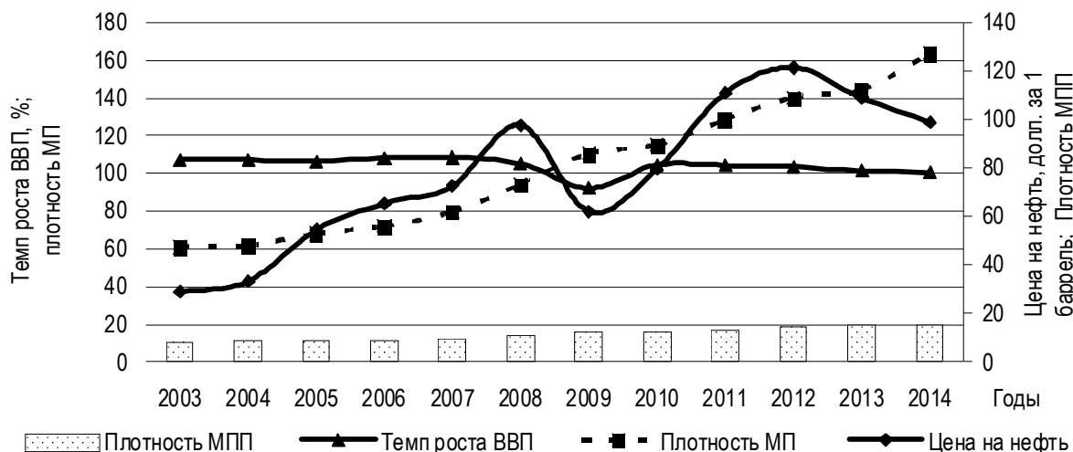
Рис. 1. Динамика показателей развития экономики и малого бизнеса в РФ

Интереснее выглядит динамика рейтингов (рис. 2). Видно, что существенных изме-