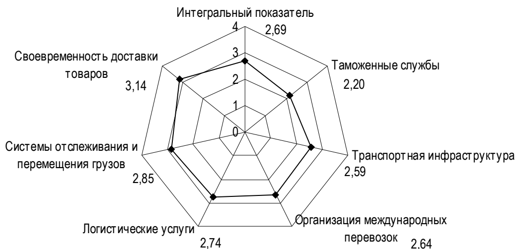
Рис. 2. Основные показатели LPI-индекса Российской Федерации по состоянию на 2014 г.

Формирование таможенного обслуживания как системы обеспечения позволяет им-