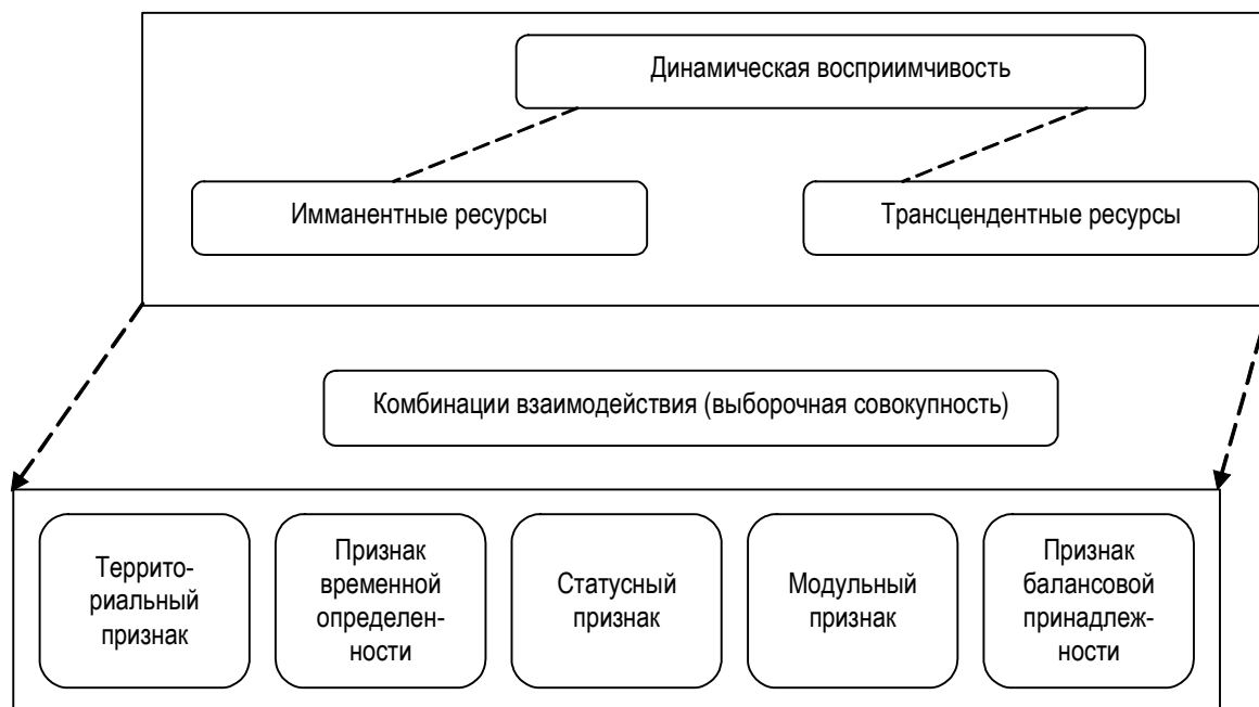
Рис. 3. Динамическая восприимчивость как ключевой признак выборочной совокупности ресурсов