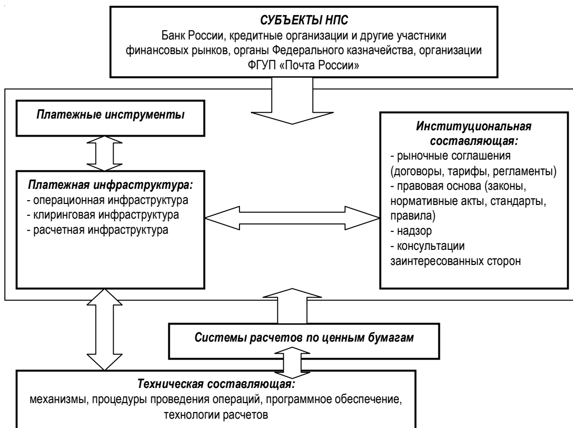
Рис. 2. Структура и механизм функционирования национальной платежной системы

Также стоит отметить мнение исследователя Н.А. Савинской, которая делает акцент на том, что платежная система представляет собой, прежде всего, финансовый институт 6 .