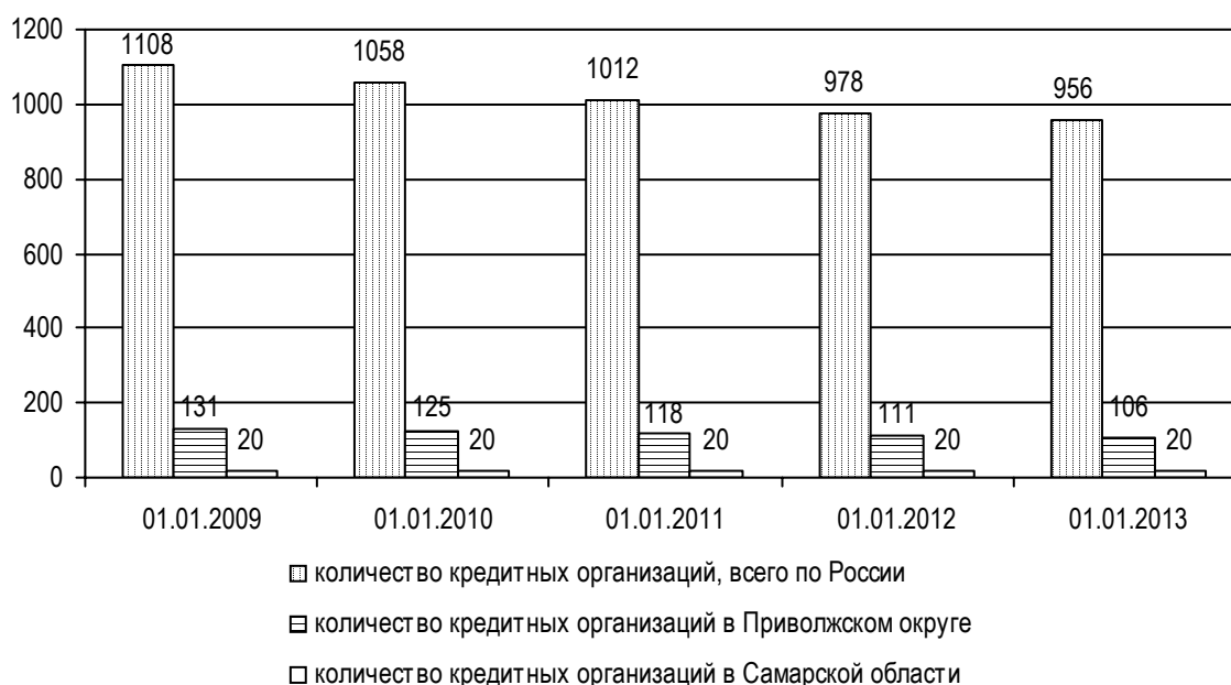
Рис. 1. Количество кредитных организаций в регионе, ед.

ство кредитно-кассовых офисов с 41 до 46, а также операционных офисов со 125 до 178.