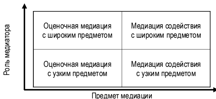
Рис. 1. Сетка Л. Рискина

Первая относится к сторонам и характеризует избранный способ ведения переговоров. Н. Александер рассматривает три основные переговорные техники: позиционные переговоры, интеграционные переговоры и “трансформационные” переговоры, или диалог, направленный на восстановление отношений между сторонами.