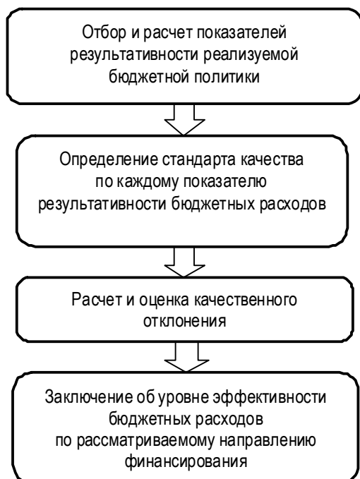
Рис. 1. Порядок оценки эффективности бюджетных расходов

Несмотря на то, что методы оценки эффективности бюджетных расходов отличаются вариативностью в измерении как издержек, так и получаемых результатов, подходы к их оценке должны основываться на поэтапной реализации ряда шагов. Обратимся к рис. 1.