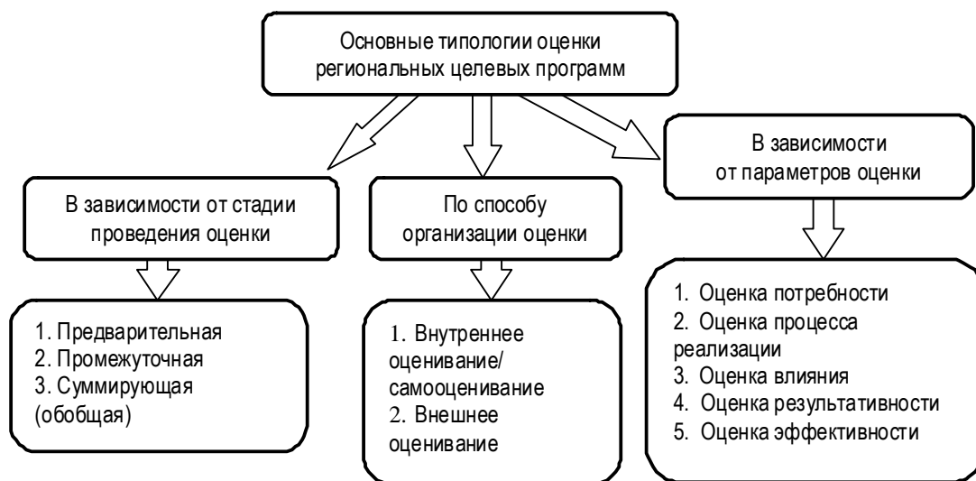
Рис. 2. Типология оценки целевых программ

♦ оценка процесса реализации (process evaluation). Представляет собой анализ качества подготовки региональной программы (состав и компетентность разработчиков, анализ методических материалов, использовавшихся при разработке, логическая схема региональной программы, экспертиза содержа-