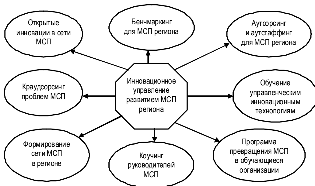
Рис. 2. Технологии инновационного управления развитием МСП в регионе