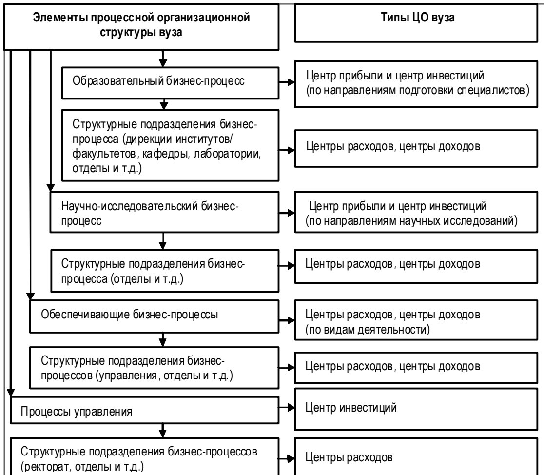
Рис. 2. Структура и типы ЦО вуза

Áóçááeáí èá í áðáçí ááðáeuí ì áí è í áó-íí -eññeááí ááðáeüñeí áí áeçí áñ-í ðí óáññí á áóçá á óáí ððò ì ðeáÙeè è èí ááñðeøèè - ñòíí áí ù è Óí ðí èðí ááí èþ áí òððeáóçí áñeí è ñeñòáí Ù óí-ðááeáí èÿ, èí òí ðáÿ ñí ìí áñòáóáð í á ñòááí áøèè, á ðáçáeðeþ ÿðeø ì ðí óáññí á, ìí áóçáí èþ èø ÿÓÓáèeðeáí ì ñè, ìí èðeðáðeþ ì áeñeí èçáðèè èí í á-íí áí (á òí ì ðeñeá ñòðáðáe-áñeí áí) ðá-çóèüðáð.