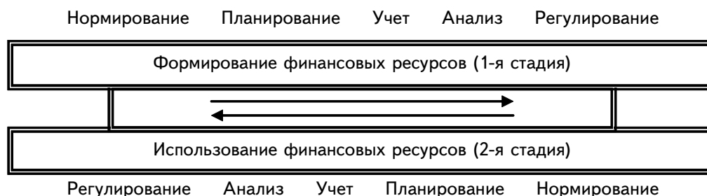
Рис. 2. Формирование функции управления финансовыми ресурсами

♦ в совокупности составляют форму и содержание управления финансовыми ресурсами в финансовой системе.