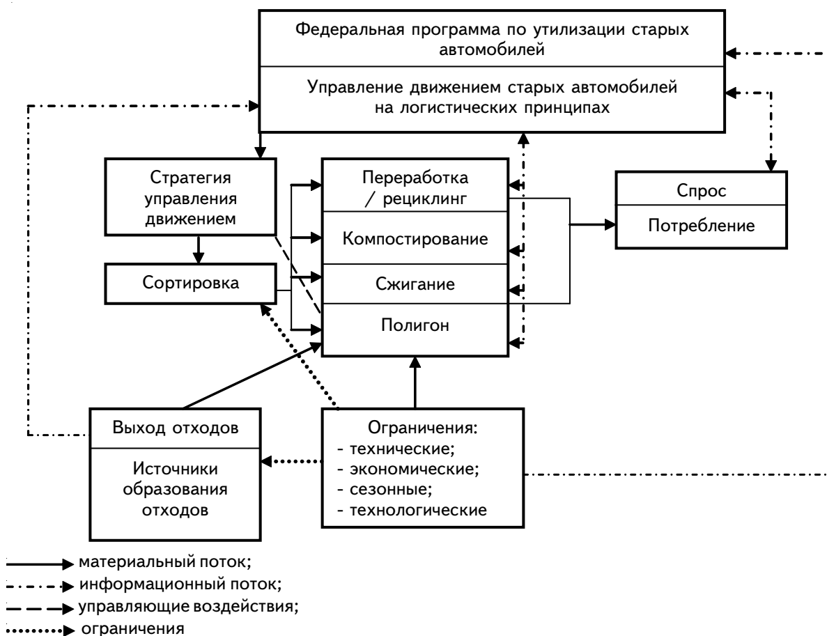
Рис. 2. Логистические цепи движения вышедших из эксплуатации автотранспортных средств

♦ рациональное использование грузоподъемности и вместимости транспортных средств