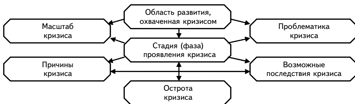
Рис. 1. Классификационные признаки кризиса

Кризисы неодинаковы не только по своим причинам и последствиям, но и по своей