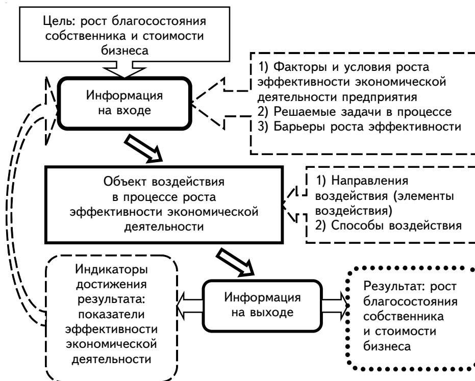
Рис. 2. Схема процесса роста эффективности экономической деятельности предприятия машиностроительного комплекса

Необходимым условием внедрения механизма является создание подсистемы оценки результатов внедрения. Данная подсистема состоит из показателей динамики эффективности экономической деятельности предприятия, которые можно разделить на следующие составляющие: