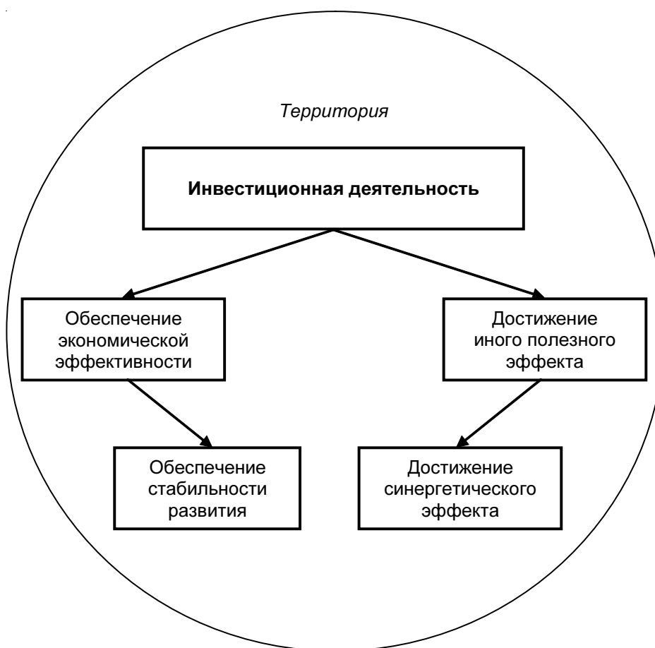
Рис. 1. Территориальные аспекты инвестиционной деятельности

Обеспечивая общественное воспроизводство через формирование и развитие капитала, инвестиционная деятельность в своей основе направлена на удовлетворение потребностей человека и опосредованно на развитие территории муниципального образования, региона страны. В связи с этим, предполага-