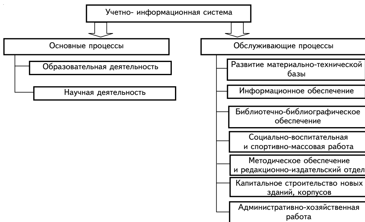
Рис. 2. Процессная модель учетно-информационной системы вуза

Удовлетворению запросов пользователей учетной информации о доходах и расходах вуза будет способствовать построение УИС по следующим направлениям: