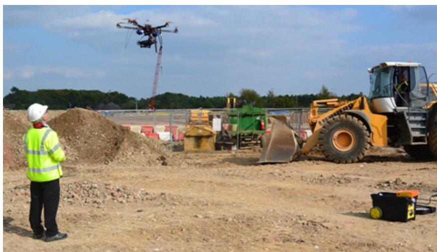
Рис. 4. Использование дрона в обследовании земельного участка строительной компанией Handy X Hub development*

Визуализация AR дополняется возможностью использования дронов ("6") в проектно-изыскательских и строительных работах на участке (рис. 4). Функционал дронов: об-