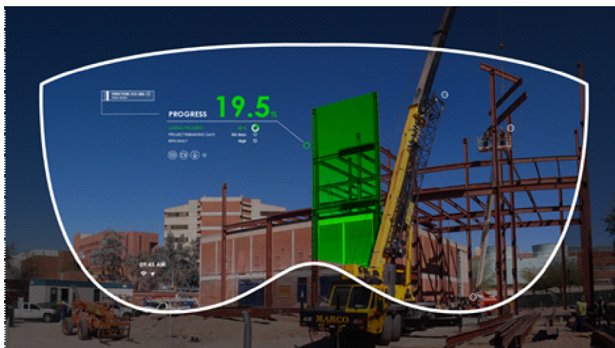
Рис. 3. Технология дополненной реальности (AR) в строительстве*

* URL: https://thebimhub.com (дата обращения: 22.01.2019).