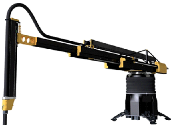
Рис. 2. 3D-принтер компании Apis Cor (Россия)*

Вторым элементом кластера инноваций индустрии ("2", 3D-print) можно выделить перенос технологии 3D-печати в производство строительных материалов и конструкций. Технология активно внедряется, свидетельством чего является серийное производство программно-аппаратных комплексов рядом российских и зарубежных производителей: Apis Cor (рис. 2), BatiPrint, WASP, KamerMaker (Ultimaker & DUS Architects), WinSunCazza Construction и др. Система 3D-печати имеет значимый потенциал сокраще-