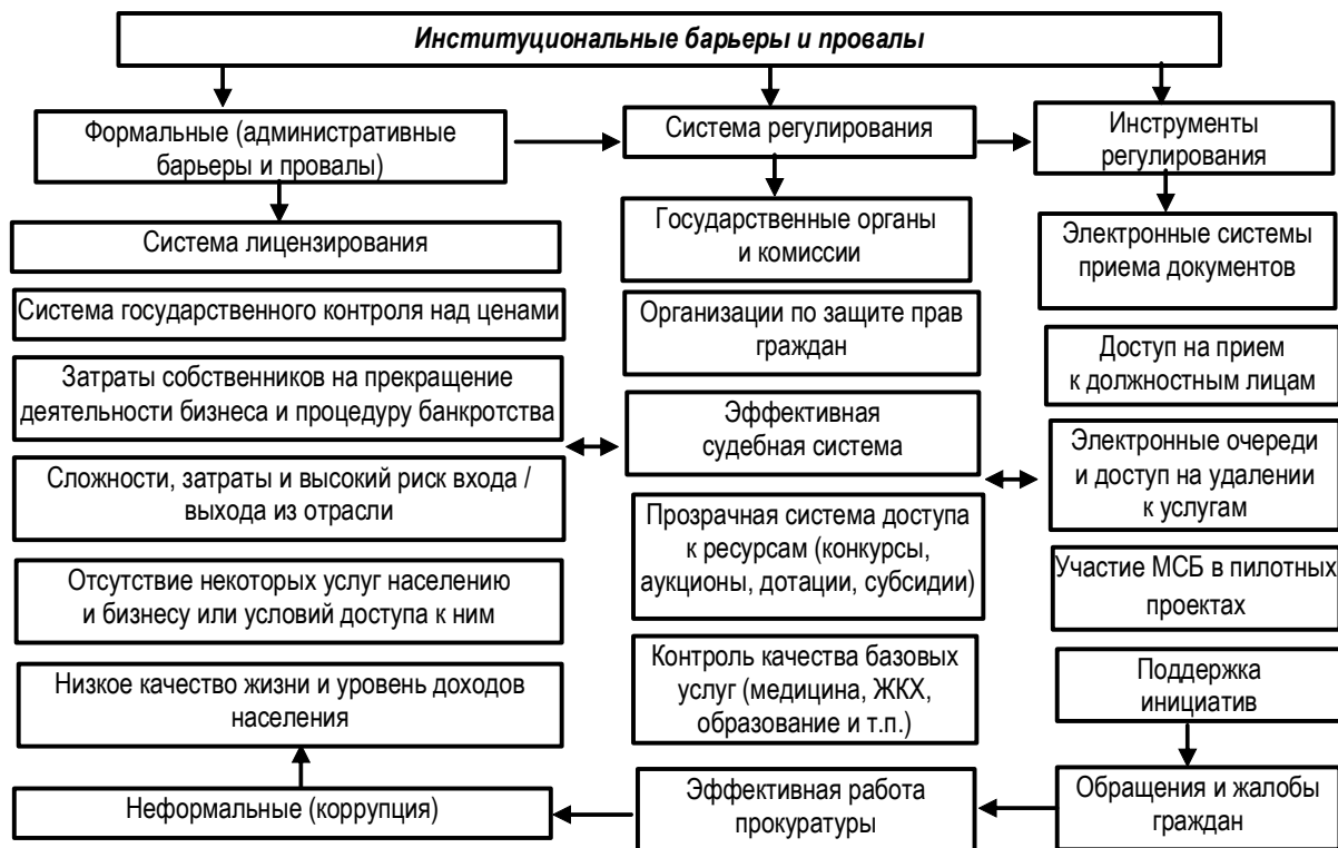
Рис. 1. Система регулирования институциональных барьеров и провалов в развитии экономики регионов

Первый показатель - данные о численности субъектов малого и среднего бизнеса в малых городах Пермского края в сравнении с аналогичными цифрами по Владимир-