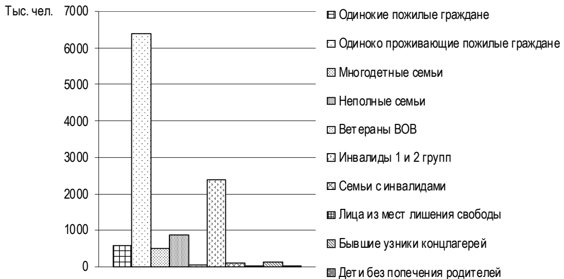
Рис. 3. Социально уязвимые категории граждан, состоящие на учете в ТЦСО

рот и детей, оставшихся без попечения родителей, а также другие категории населения.