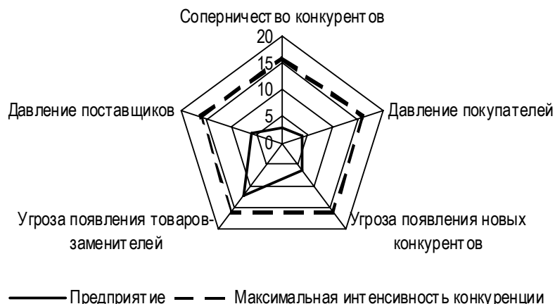
Рис. 3. Интенсивность воздействия на предприятие сил конкуренции